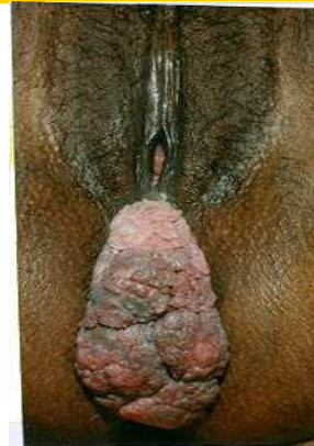
El PVH se puede manifestar como Condiloma Acuminado

Se ha demostrado la presencia de PVH cervical o vulvar en un 17% a