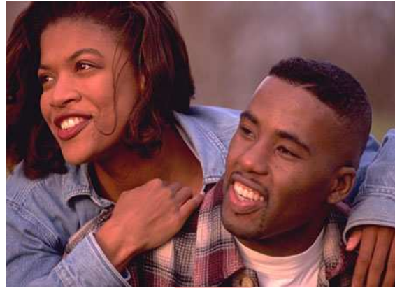
Las ITS pueden pasar inadvertidas hasta complicarse

posibilidad de que se presenten embarazos ectópicos que, incluso, pueden