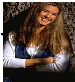
Las mujeres son más vulnerables a las ITS