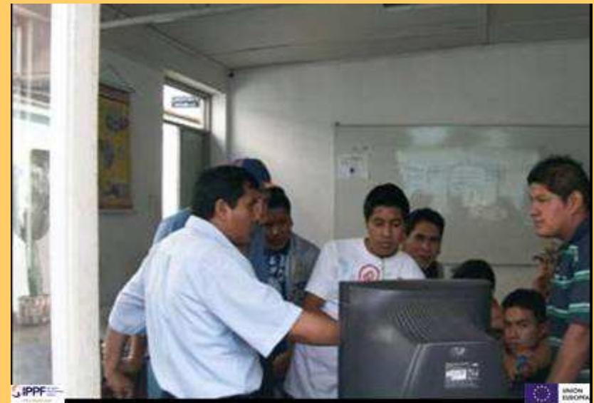
Taller de Reparación de Computadora En Instituto EIGER con Voluntarios de Comas