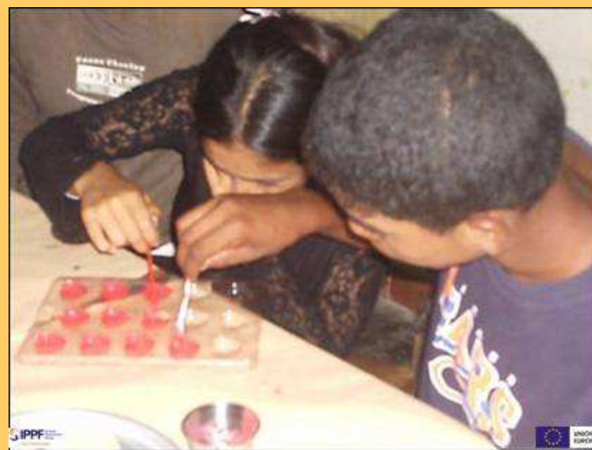
Taller de Chocolatería, con jóvenes Voluntarios Callao