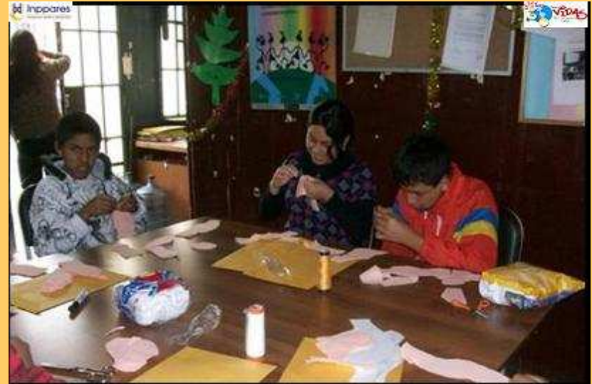
Actividades productivas (Taller de Confección de Peluches). Estación Educativa Juvenil- Comas

Con lo cual se ha logrado que estos jóvenes puedan acceder a espacios laborales y combatir sus condiciones de marginalidad y exclusión, a través de su propia generación de ingresos.